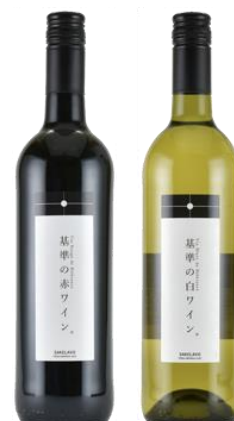
「基準の赤ワイン/白ワイン」

当社では、「SAKELAVO Camera」の導入を通じて、お客さまがご自分でお酒を探せる、楽しい売場づくりを実現いたします。さらに、お客さまの嗜好を知ること、マーケティングに基づいたマーチャンダイジングを可能とするほか、今後も、リアルとデジタルを融合した顧客体験を創造してまいります。