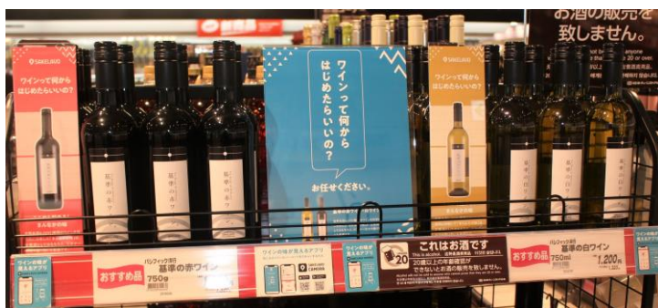
「マルエツ 船橋三山店」での展開事例