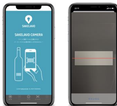
「SAKELAVO Camera」アプリの ホーム画面、バーコードの読み取り画面

「SAKELAVO Camera」とは、商品のJANコード(バーコード)を読み込むことで、味わいチャート、味わいマップを基に、味わいと商品の情報を簡単に見ることができるスマートフォンアプリです。マルエツのワイン売場に設置されたQRコードなどから「SAKELAVO Camera」をダウンロードすることで、約6,000種のワインの味わいデータに無料でアクセスできるようになります。