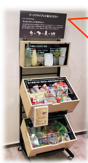
フードバンクかわさき