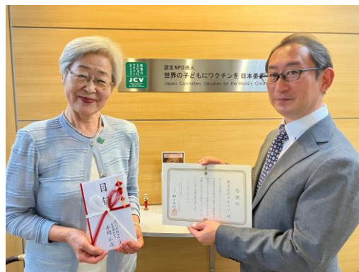
認定NPO法人 世界の子どもにワクチンを 日本委員会(JCV)での贈呈式の様子

当社は、世界の子どもたちが健康で豊かに暮らせる環境づくりに貢献するとともに、未来を担う子どもたちの健やかな成長と持続可能な社会の実現を願い、今後も、お客さまとともにこの活動を続けてまいります。